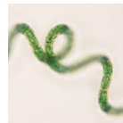
スピリリナ マキシマエクス

『永久華』では、2種の光ケアサ ポート成分を配合。塗布した 成分は、光により刺激を受ける ことで活性化されます。肌内 部で効果を発揮してハリ弾力 をサポート。わずか10日間で の即効性シミ改善・シワ改善 データも報告されています。