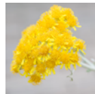
ヘリクリスム アングスチホリウム 花エキス